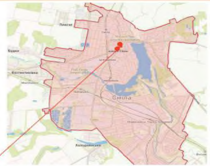
Схема маршруту №2

Зупинка громадського транспорту «ЦЕНТРАЛЬНА» - Управління праці та соціального захисту населення